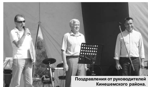
Поздравления от руководителей Кинешемского района.