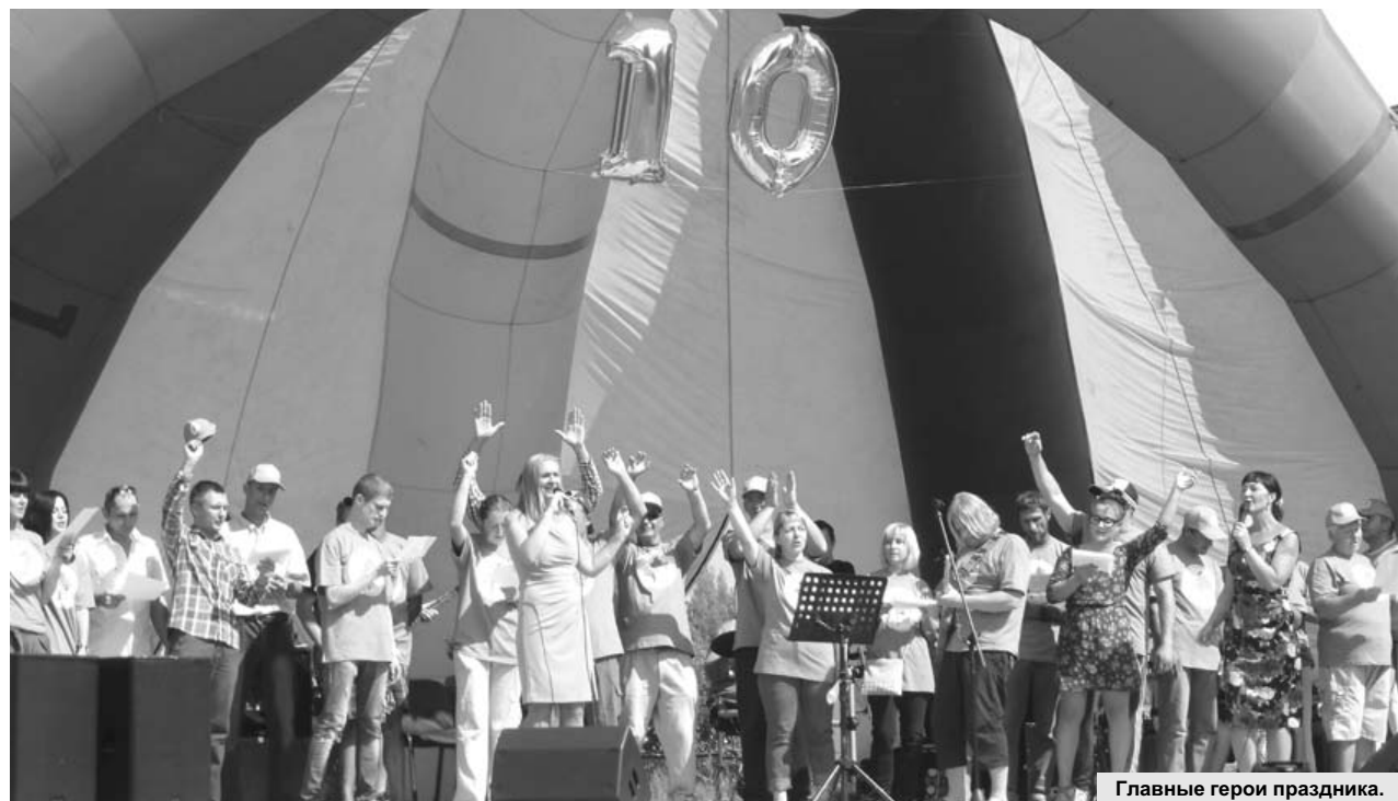
Главные герои праздника.